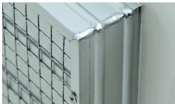
Trafo Ventilasjonsrist sett fra baksiden