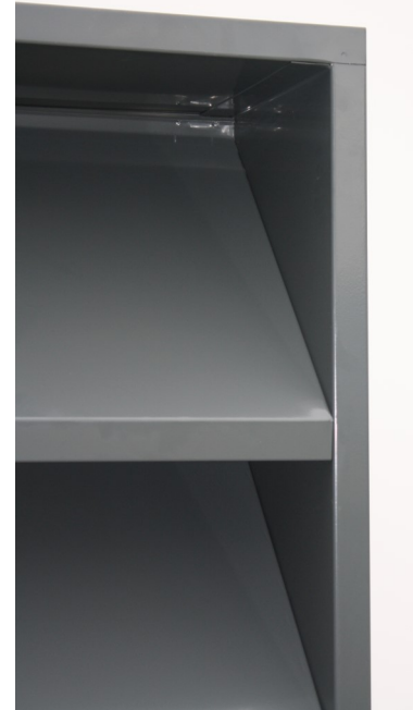
Lydreduserende Ventilasjonsrist sett fra baksiden.